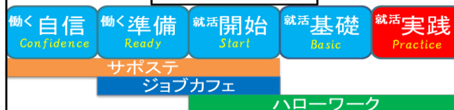
しごと館セミナー分類表

※未登録の方は新規登録してセミナーに参加していただくことも可能ですのでご相談ください!