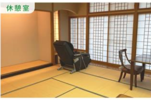
冷蔵庫・電子レンジ完備、豊の広い場所で休憩ができます