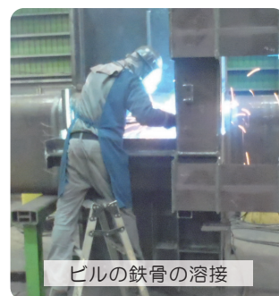
ビルの鉄骨の溶接

👉 多数の修了生が現場で活躍中です！年齢・経験不問！初めての方向けの内容となっております！