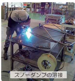
スノーダンプの溶接

安全衛生、溶接の基礎知識・技能の習得、各種溶接機の取扱い方法 製図の基礎知識・作図方法、JW_CAD基本操作 溶接技能者評価試験対策、産業用ロボットの教示 など