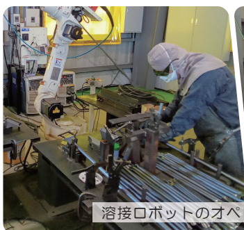
溶接ロボットのオペレーティング