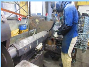
⑤バリ取り(切り離したところの金属の凸凹など)を行い、製品を仕上げていきます。大きな部品、表面などは機械で削り、小さな部品や内側などはペンシル型の機械で、削り綺麗に仕上げていきます。