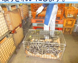
⑥製品を最終チェック(外観検査)し、出荷準備を行います。