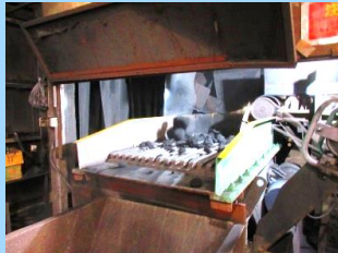
③金属が冷え、製品の完成前の形になってきました