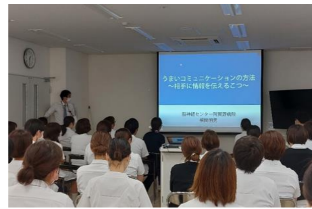
院内勉強会：すべての職員が受講できるように、同じ内容を数回実施しています。