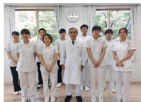
集合写真：看護師は、医師やリハビリスタッフなど多職種で連携し働いています。