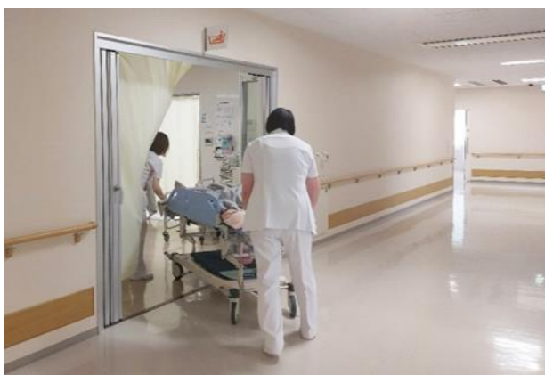
病棟の風景：第1病棟から第3病棟まであり、各病棟スタッフがチーム体制で動いています。