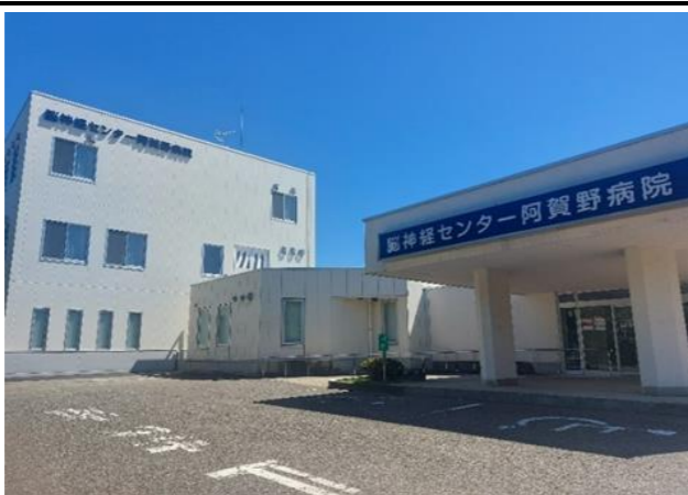
脳神経センター阿賀野病院外観：2023年に管理棟が新しくなりました。