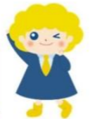
パートタイム・有期雇用労働法 キャラクター「ハロちゃん」