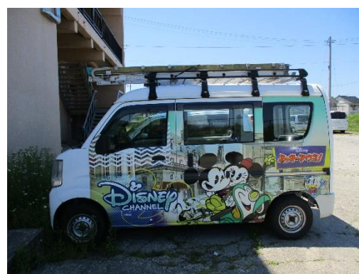
異常があれば現場に駆けつけます