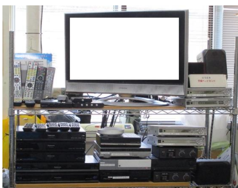
複数の機器で各地域の電波受信状況を確認します