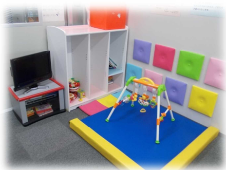
★キッズコーナーです★