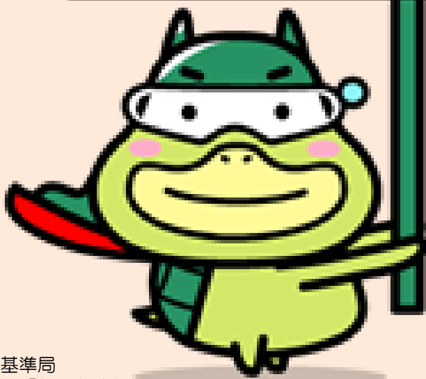
厚生労働省 労働基準局 広報キャラクター「たしかめたん」