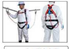
ハーネス型安全帯