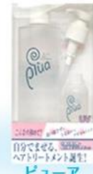
ピュア ヘアトリートメント