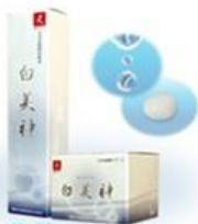
白美神 ローションクリーム