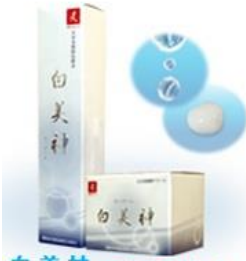
白美神 ローションクリーム

▶ 頭髪用化粧品及び基礎化粧品各種・医薬部外品・ トイレタリー品・加工品・食品添加物・化学品の製造 販売および輸出を行っております