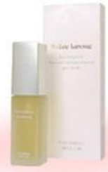
ノーランラモース エッセンス