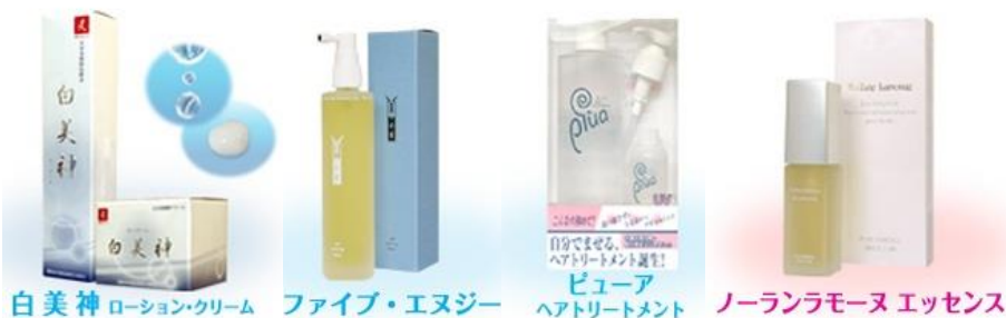
白美神 ローションクリーム ファイブ・エヌジー ピュア ヘアトリートメント ノーランラモーヌ エッセンス