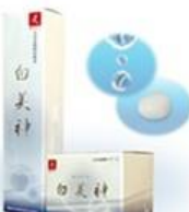
白美神 ローションクリーム