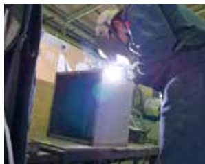
配電ボックスの溶接作業

自らが希望する企業で、約1か月間「研修」という形で、より実践的な技能や技術を習得します。入所後に習得した金属加工法や各種溶接法の知識と技能に、より磨きをかける機会になります。この期間に企業側と受講者の意向が一致すれば、そのまま就職することも可能です。