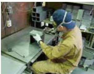
ステンレス製品の加工作業