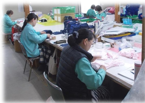
検品 入念にチェックし、更に機械でも異物検査をしてから出荷します