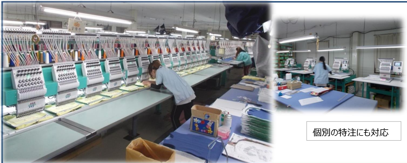
個別の特注にも対応