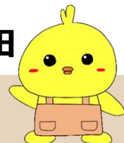
ハローワーク大和高田 公式キャラクター きまるくん