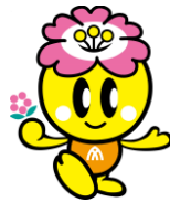
大和高田市マスコットキャラクター みくちゃん