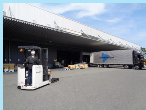
フォークリフト作業