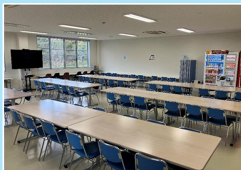
きれいな食堂です