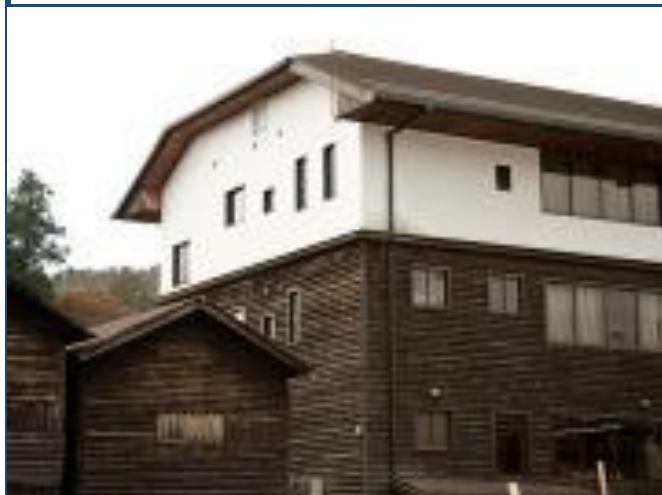
吉野製材工業協同組合事務所