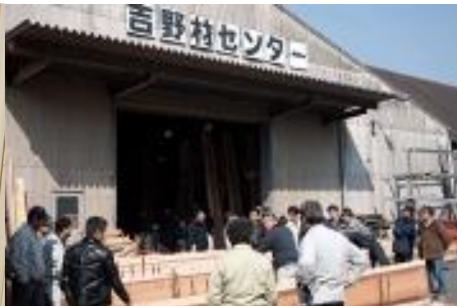
吉野材センター 市場の様子