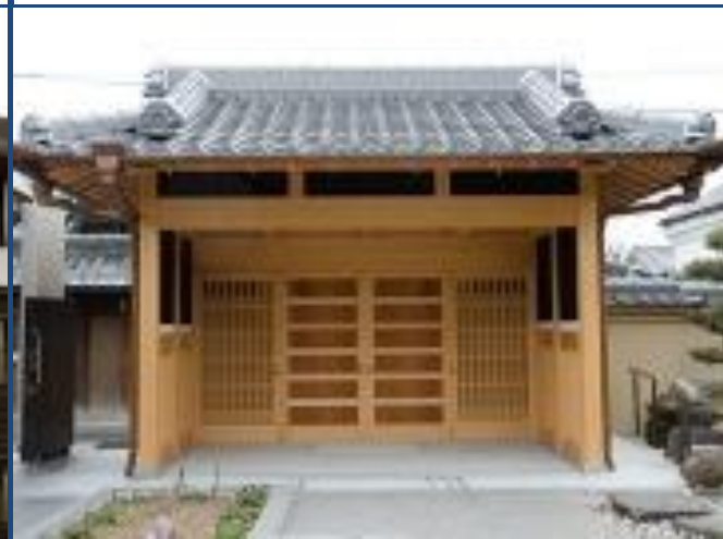
吉野材を使用した玄関風景