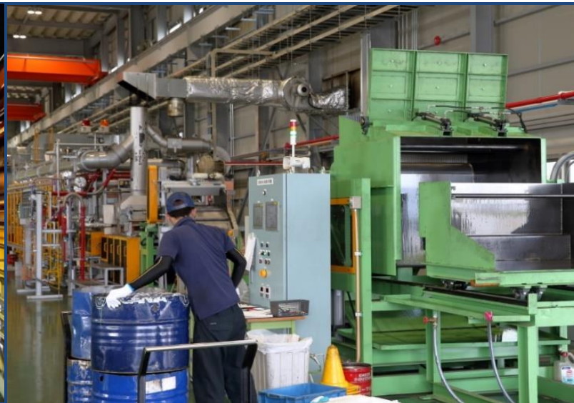
金属製品を熱処理炉に投入