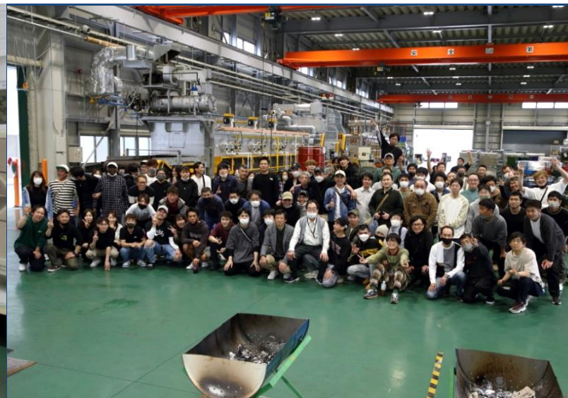
今年4月 本社、奈良、合同社内バーベキュー開催