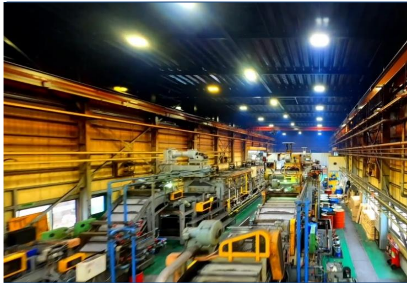
ドローンで撮影した工場の設備です。