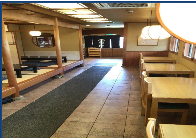
平宗 吉野本店 内観