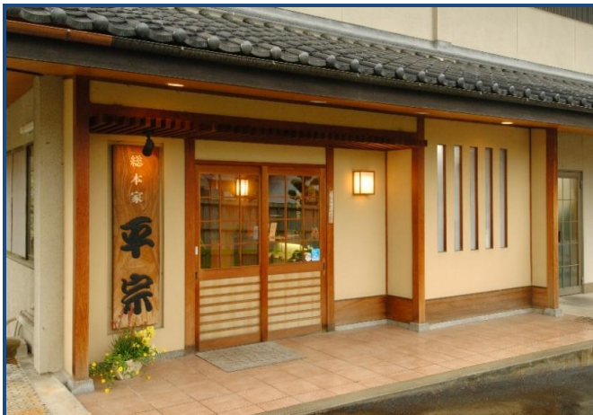
平宗 吉野本店 外観