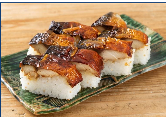
柚庵 焼さばずしも人気です