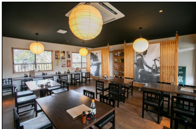
平成26年オープン 豆腐料理専門店 「豆富茶屋 林」