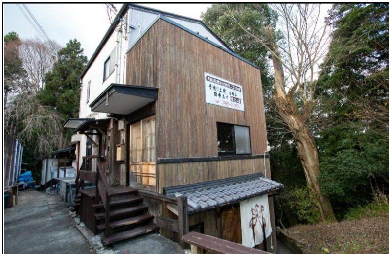
創業50年、吉野町唯一のとうふ店