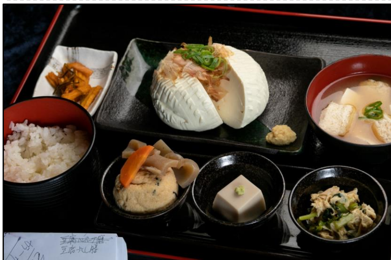
出来立ての豆腐を使った料理を提供