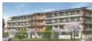
高齢者総合福祉施設 ぽれぽれケアセンター白樺