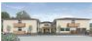
住宅型有料老人ホーム ぽれぽれ白樺コンフォート

来訪予定日は調整の上、決定します。 場合によりご要望にお応えできない場合がございます。