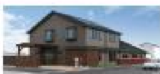
在宅支援交流センター/アイサービス ぽれぽれ八木西スクエア