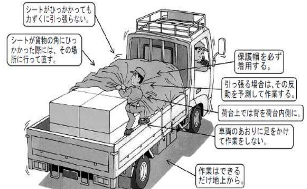
(悪い事例とその改善方法)

運転者を雇用する事業者及び荷主・配送先・元請事業者のいずれも、作業者が安全に荷の積卸し作業に従事できるよう協力してください。