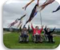
鯉のぼり外出レク