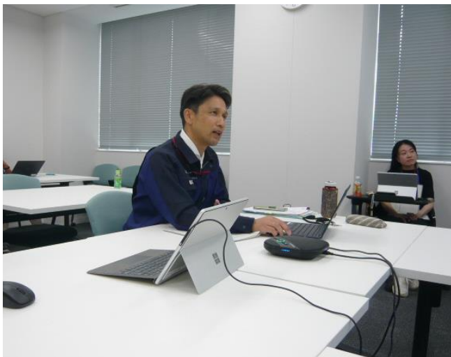
▲改正労基法、改正安衛法等について説明を行っている様子 （奈良労働基準監督署）