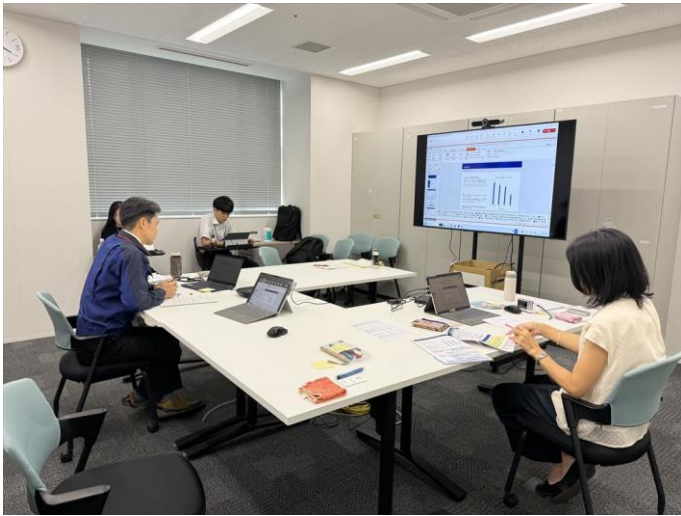
▲説明時の会議室の様子（大手前合同庁舎）