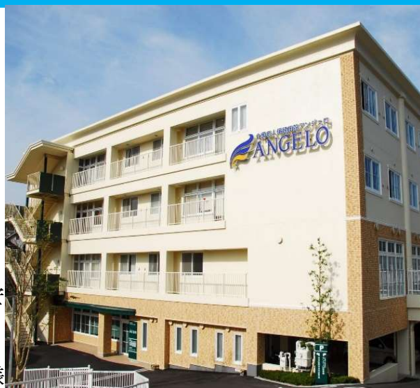
介護老人保健施設アンジェロ

あすか会の理念は、『地域リハビリテーションを推進し、地域に貢献する』。住み慣れたところで、そこに住む人々と共に、安全に生き生きとした生活が可能となるよう、質の高いリハビリテーションを提供し、また地域の方々の声に耳を傾け、惜しみなく支援し、不可能を可能にできる力を身に付け、地域の皆様や社会に貢献していくことです。