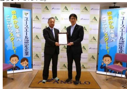
ユースエール認定証交付式の様子