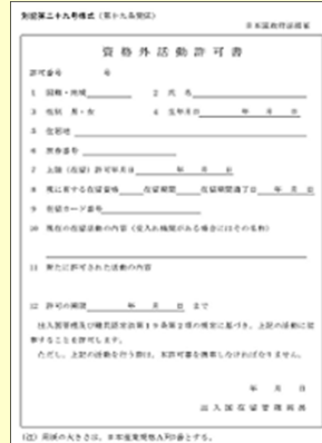
※3 資格外活動許可書