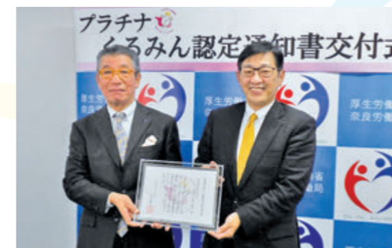
プラチナくるみん認定通知書交付式