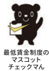
最低賃金制度の マスコット チェックマン