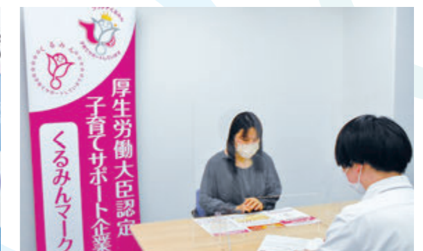
くるみん認定申請手続き相談