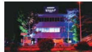
奈良労働局庁舎 最低賃金広報 プロジェクションマッピング