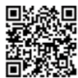
動画ライブラリー