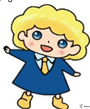
パートタイム・有期雇用労働法 キャラクター「パピョウ」ちゃん