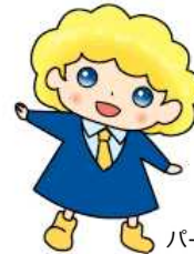
パートタイム・有期雇用労働法 キャラクター「パゆう」ちゃん

令和4年4月1日～(女活法届出 労働者数101人以上義務化) 令和3年1月1日～(育児・介護休業法改正)