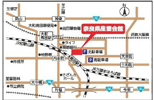
■近鉄大阪線「大和高田」駅東出口徒歩5分、JR万葉まほろば線「高田」駅東出口すぐ お車の方は、併設駐車場をご利用ください。

場所 奈良県産業会館 1階 展示ホール 〒635-0015 大和高田市幸町2番33号