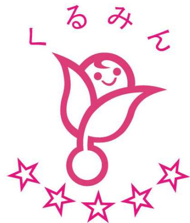
次世代認定マーク「愛称:くるみん」

さらに、平成30年3月31日までにくるみん認定を受けた企業については、次世代育成支援に資する資産であって一般事業主行動計画に位置づけた資産について、税制優遇措置が設けられています。