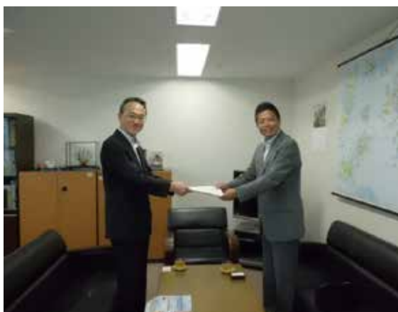
船橋代表取締役社長