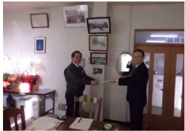
富永代表取締役社長