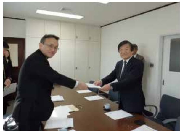
星野代表取締役社長