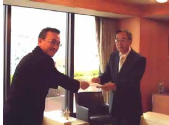
本村代表取締役社長