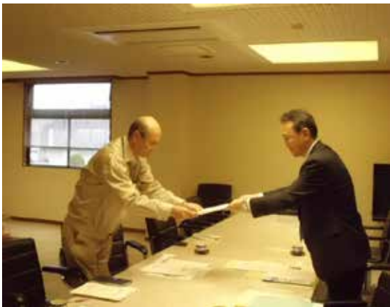
西坂取締役執行役員総務部長