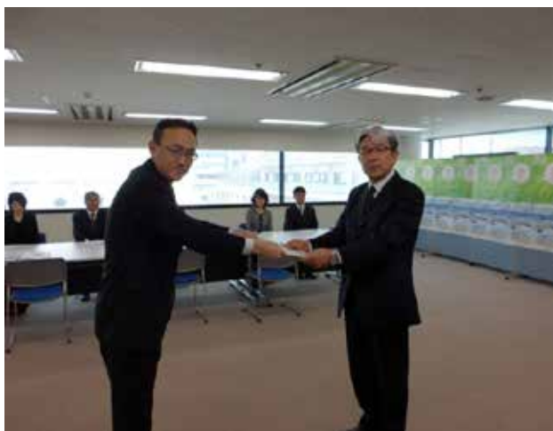
増山代表取締役社長