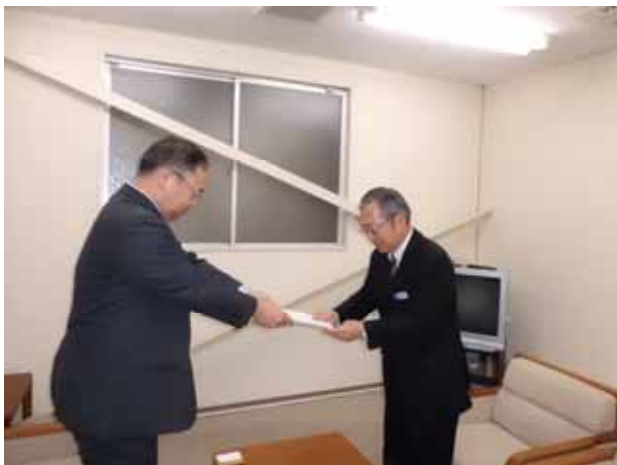
中牟田代表取締役社長