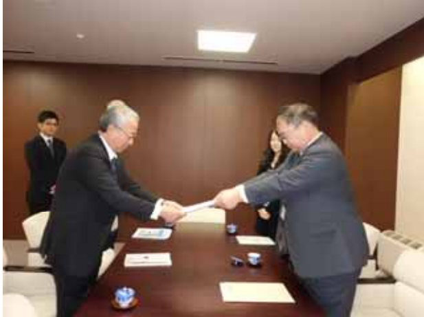
森代表執行役専務