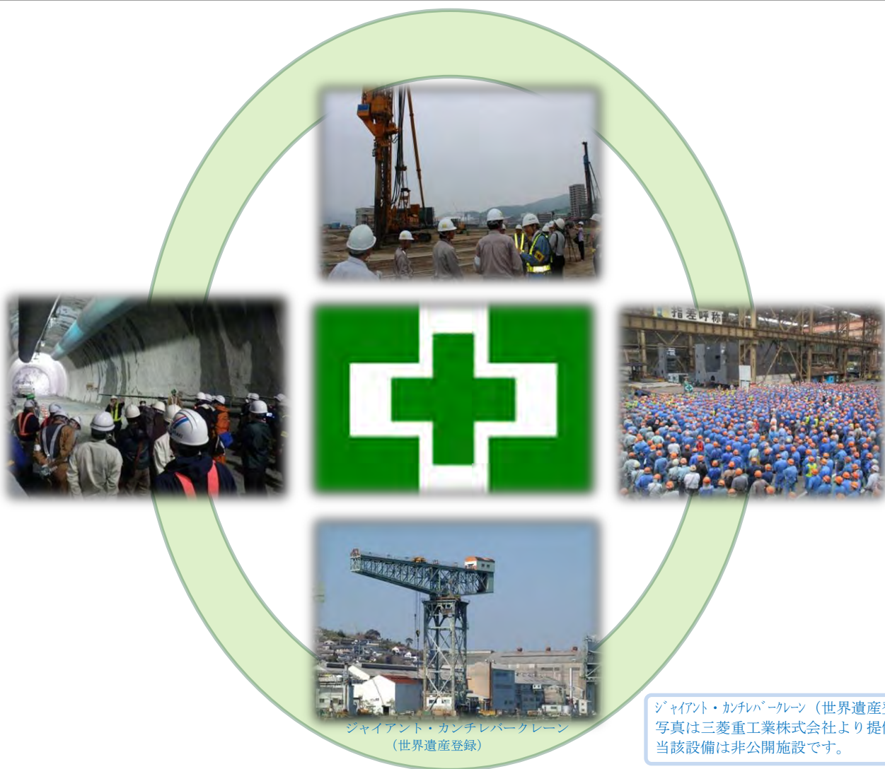
ジャイアント・カンチレバークレーン (世界遺産登録)

ジャイアント・カンチレバークレーン（世界遺産登録）の 写真は三菱重工業株式会社より提供。 当該設備は非公開施設です。