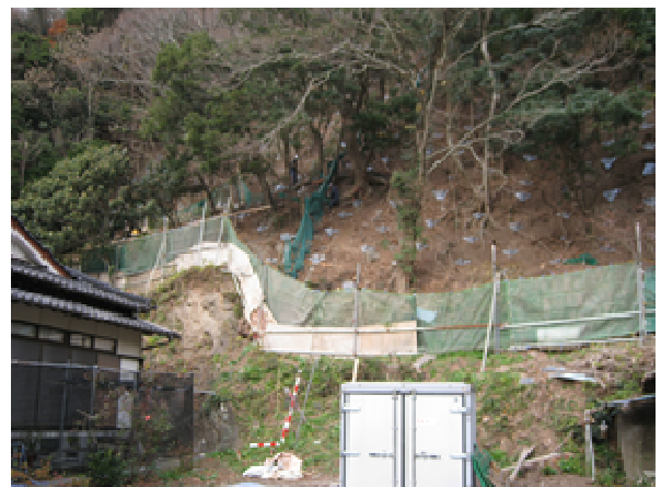
安全帯の確実な使用を確認