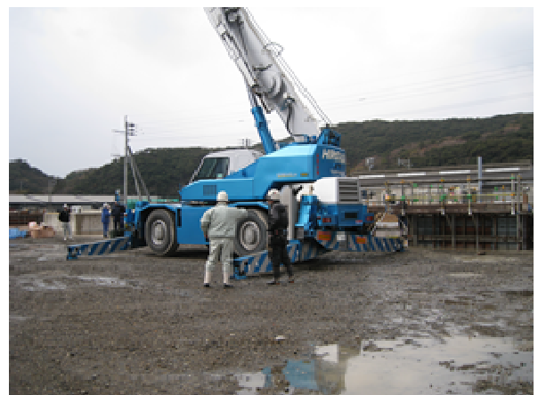
旋回範囲内の立入禁止を指導