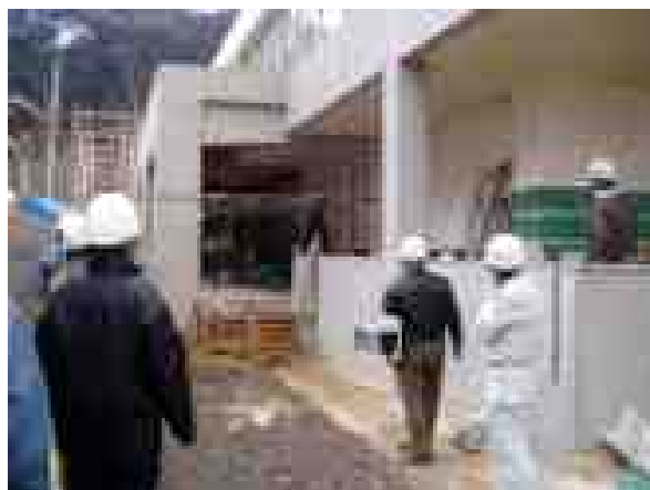
足場の点検等について指導

3. 対馬労働基準監督署におきましては、今後も災防団体と連携し、建設業における労働災害の撲滅に一層努めてまいります。各現場におかれましても、現場を再点検していただき、安全最優先での施工をお願いいたします。