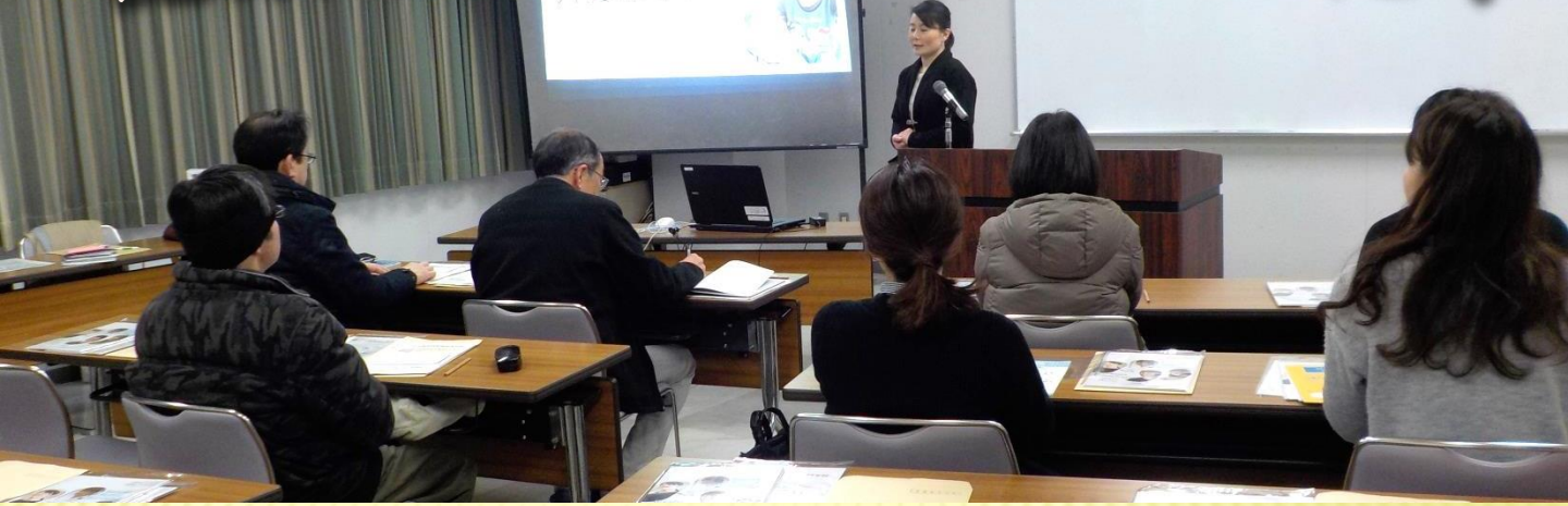
▲訓練実施施設様より訓練内容の説明