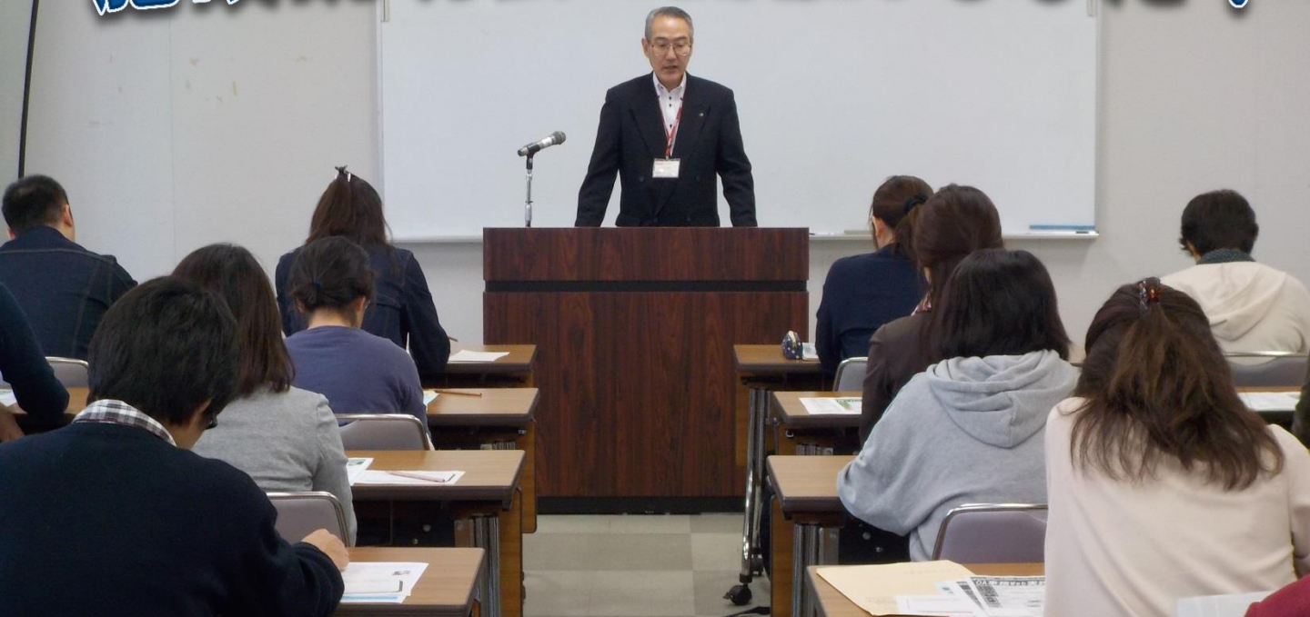
▲訓練実施施設様より訓練内容の説明（日建学院 長崎校様）