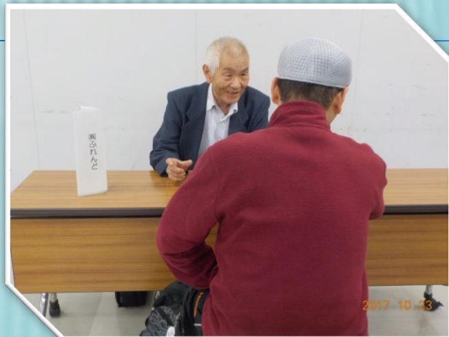
▼株式会社 られんど様