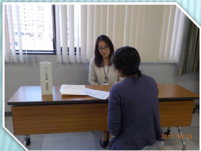
▲パールの風長崎校様