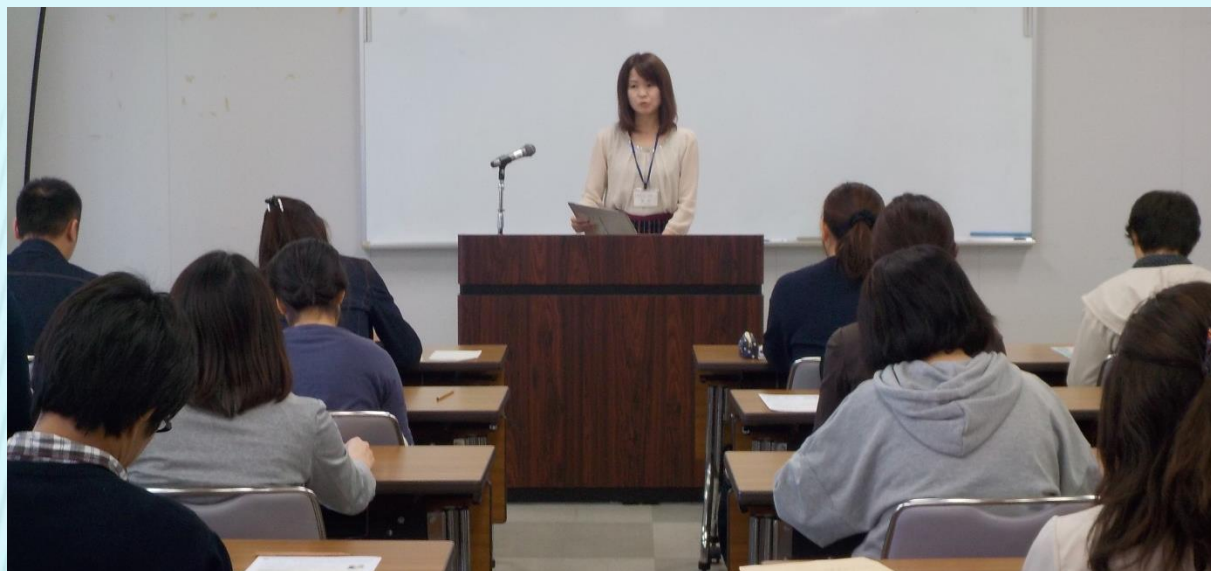
▲ハローワークより求職者支援制度の説明