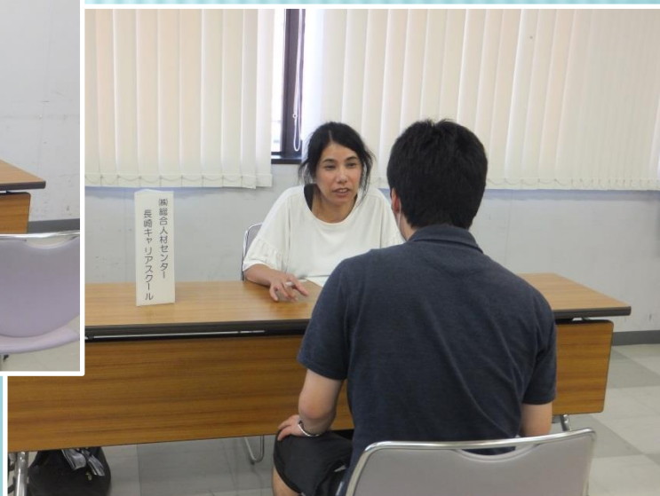
▼(株)総合人材センター 長崎キャリアスクール様