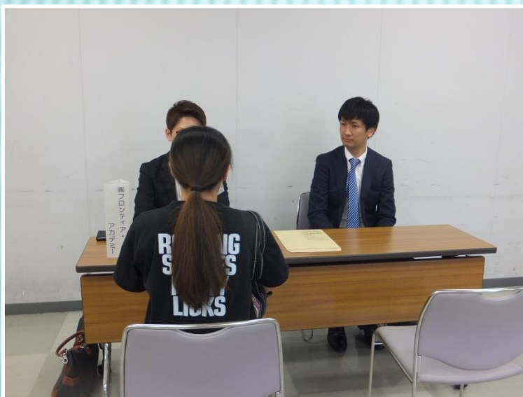
▲(株)フロンティア・アカデミー様