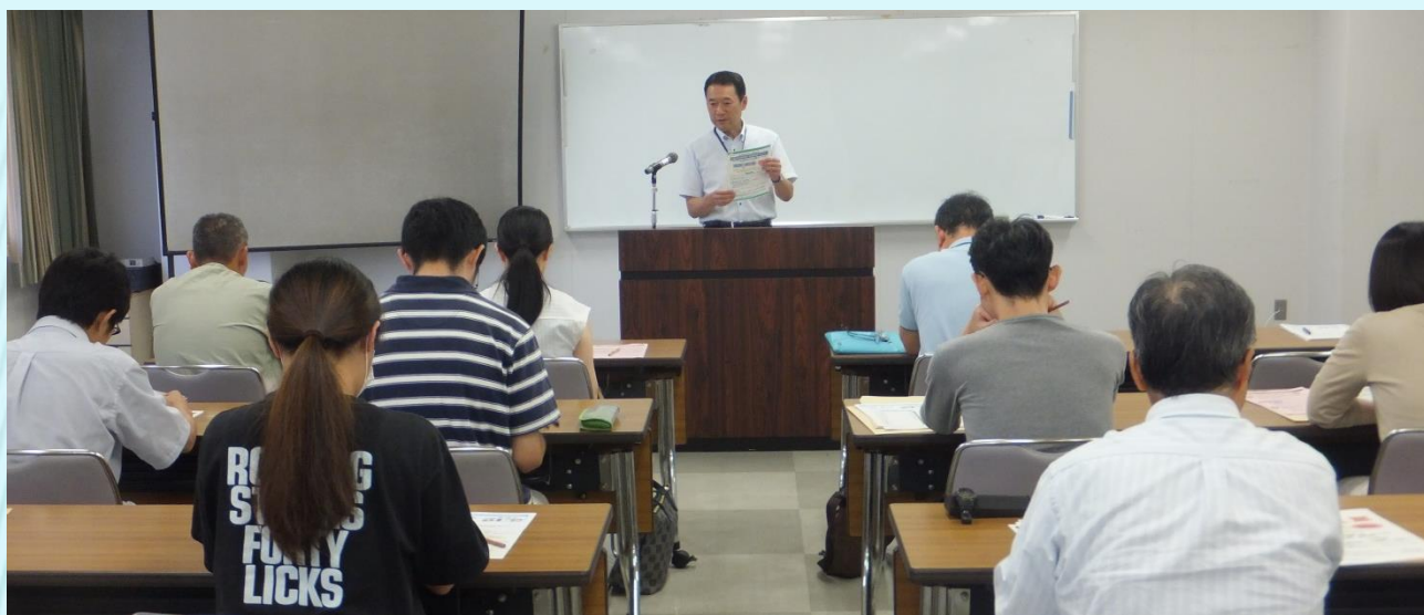
▲ハローワークより求職者支援制度の説明