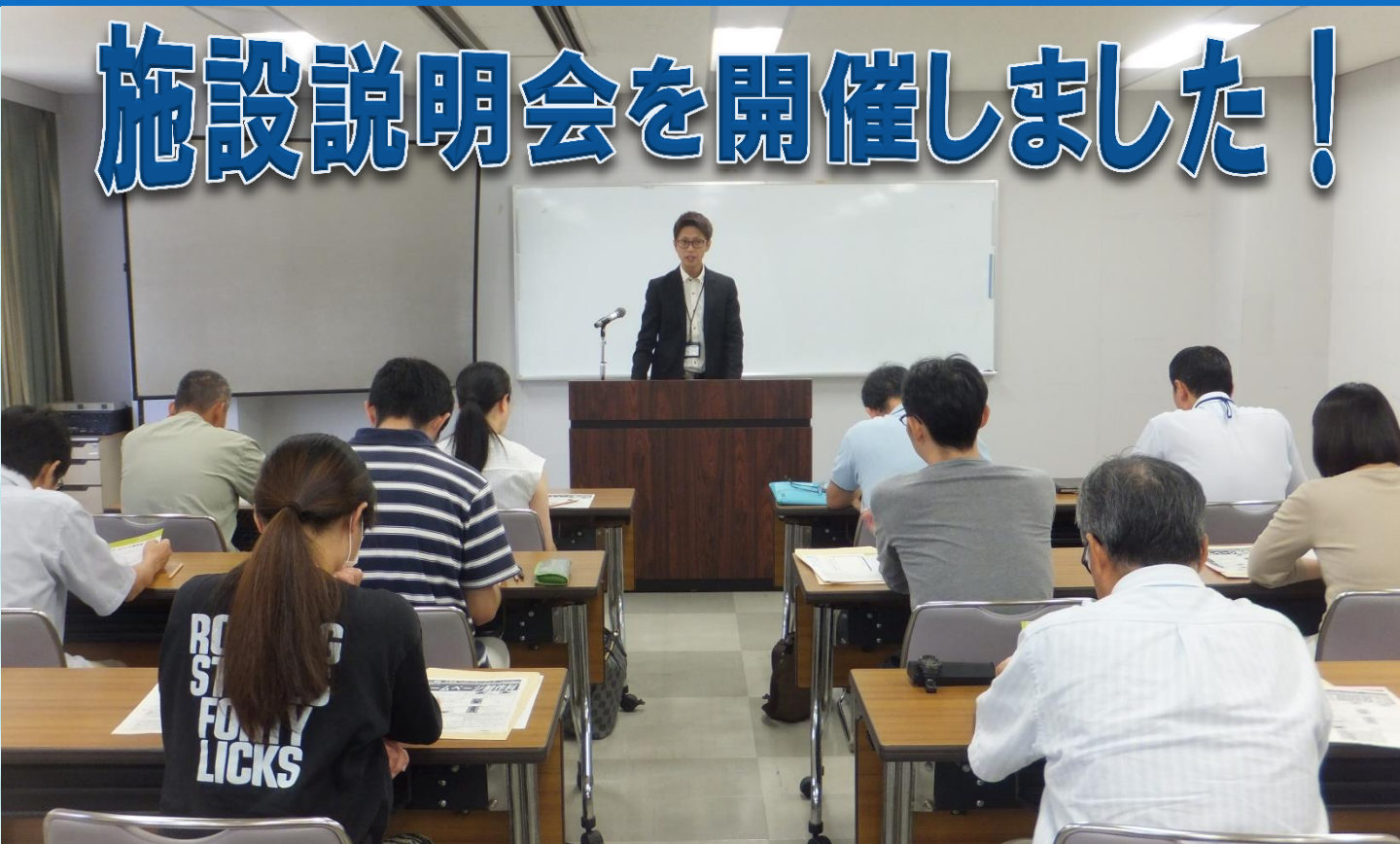
▲訓練実施施設様より訓練内容の説明