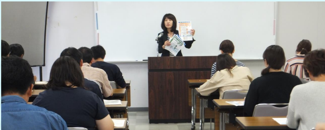
▲ハローワークより求職者支援制度の説明