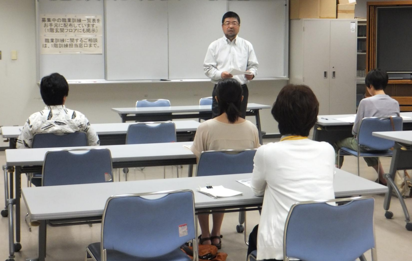
▲ 株式会社パソコン村愛野訓練センター様