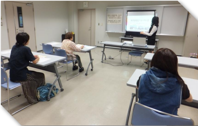
▲株式会社ピーシーベース諫早教室 様