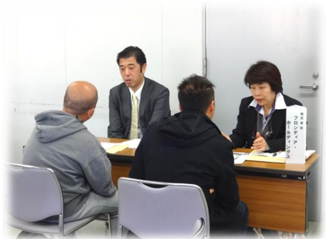
株式会社 フロンティア・ホールディングス 様