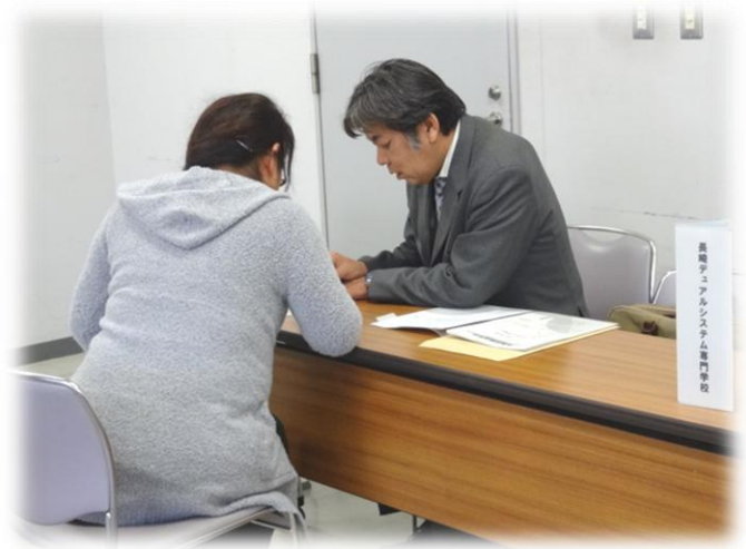
長崎デュアルシステム専門学校 様