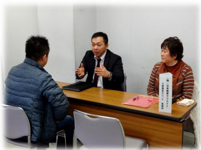
株式会社 日本教育クリエイティブ三幸福祉カレッジ 長崎校 様