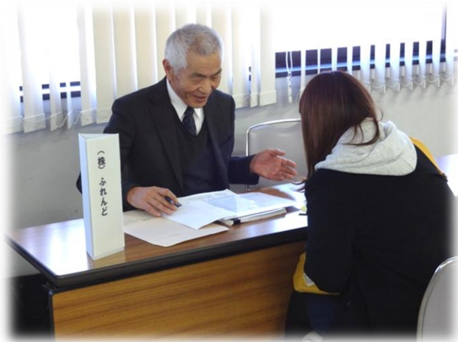
株式会社 ふれんど 様