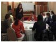
女性技術者によるワークショップ