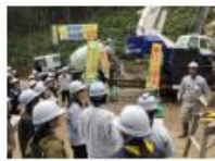
女性技術者の現場見学会