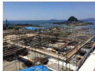
恐竜博物館（長崎市）

【ご協力いただいた団体】 （一社）長崎県建設業協会、（一社）長崎県ほ装協会、（一社）長崎県中小建設業協会、長崎県管工事業協同組合連合会 長崎県型枠工事業協同組合、（一社）長崎県空調衛生設備業協会、（一社）長崎県造園建設業協会、長崎県鉄筋工事業協同組合 協同組合長崎県鉄構工業会、（一社）長崎県測量設計コンサルタンツ協会、長崎県室内装飾事業協同組合、長崎県土木部