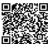
STOP！ 転倒災害プロジェクト

転倒災害防止、熱中症予防、SDS（安全データシート）に関する情報はこちらでも発信しています。