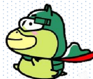
労働条件の明示・確認の実施促進のための 広報キャラクター「たしかめたん」

厚生労働省のホームページに労働条件通知書の見本が掲載されていますのでご利用ください。また、監督署でもお渡ししています。