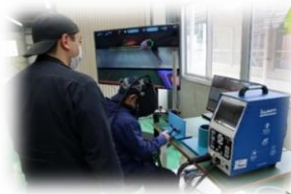
AR (拡張現実) 溶接