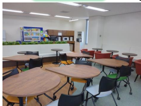
リフレッシュルーム完備！