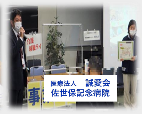
医療法人 誠愛会 佐世保記念病院