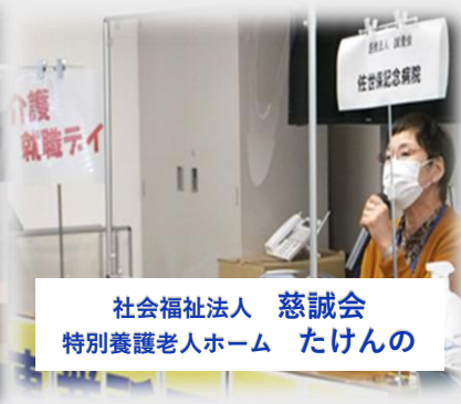
社会福祉法人 慈誠会 特別養護老人ホーム たけんの