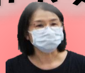
有限会社 スマイルケア