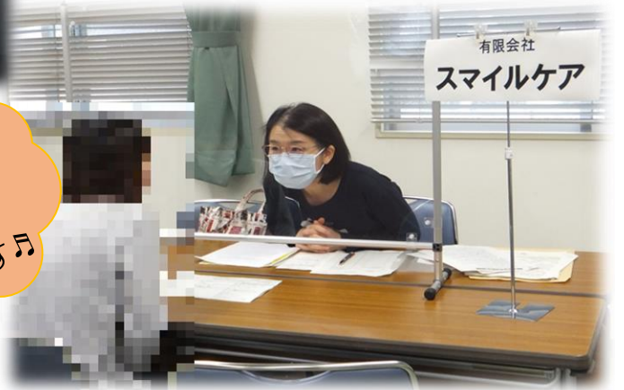
有限会社 スマイルケア