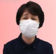
有限会社 エクセル