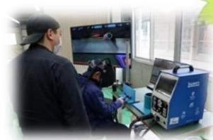
シーケンス制御 3次元CAD・3Dプリンター 3Dマイホームデザイナー AR (拡張現実) 溶接